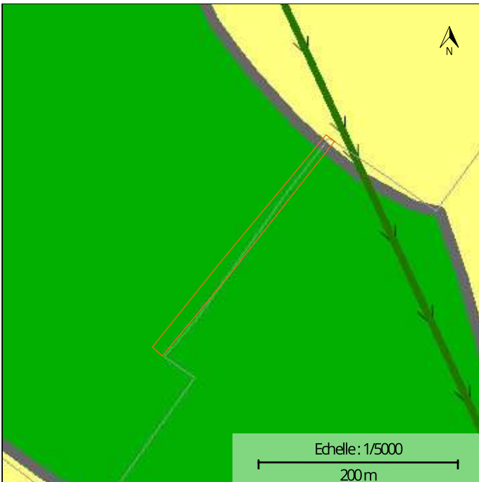
Plan de secteur