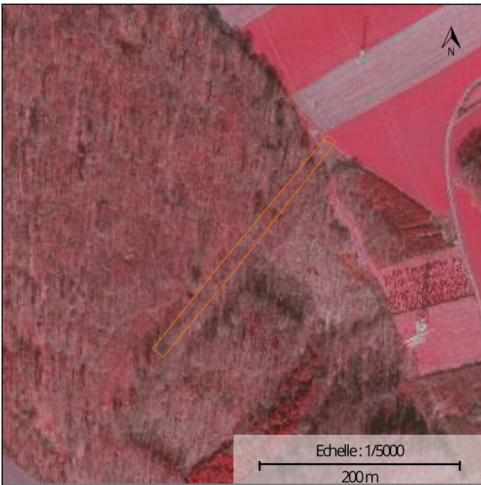
Photographie aérienne infrarouge (SPW)